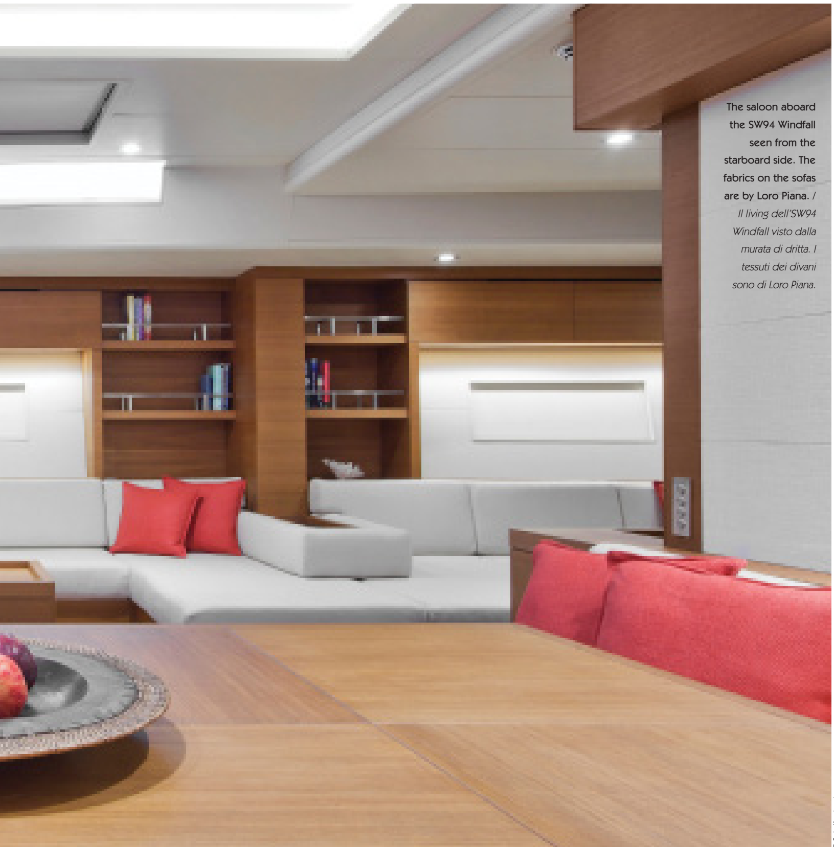
The saloon aboard the SW94 Windfall seen from the starboard side. The fabrics on the sofas are by Loro Piana. / Il living dell' SW94 Windfall visto dalla murata di dritta. I tessuti dei divani sono di Loro Piana.